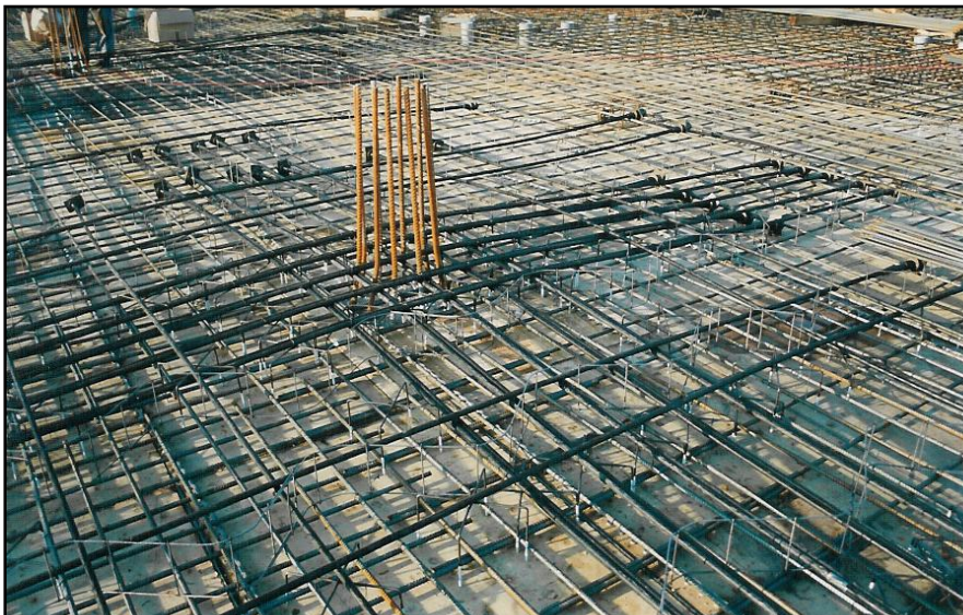
▲ Uložené monostrandy, fáze před zaklopením horní výztuži.