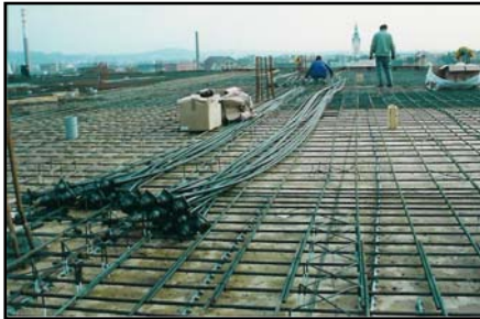
▲ Prefabrikované monostrandy.