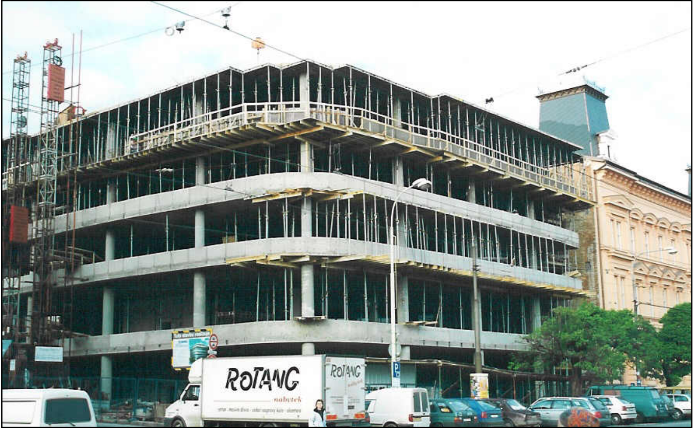
▲ VZP Brno ve výstavbě.