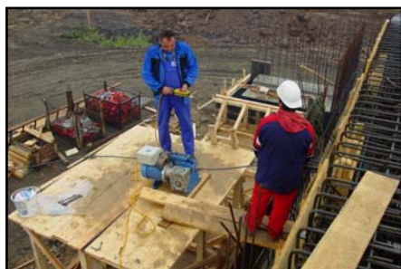
▲ Prostrkávání lan.