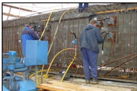
▲ Příprava před injektáží.