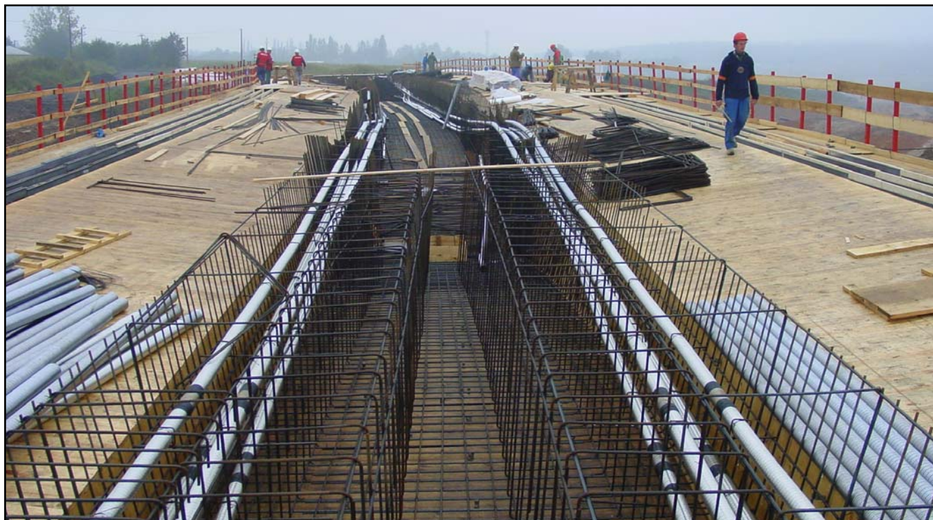
▲ SO 209 ve výstavbě.