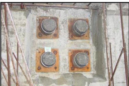
▲ Zainjektované kotvy Ec 6-19 bez dutin.