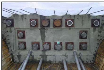
▲ Pracovní spára s kotvami a spojkami.