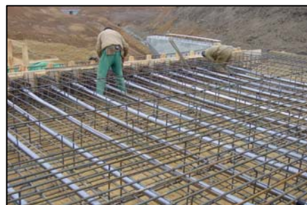
▲ Kabely kotvené do čela konstrukce.