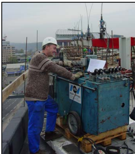
▲ Hydraulická pumpa EHPS-14/1