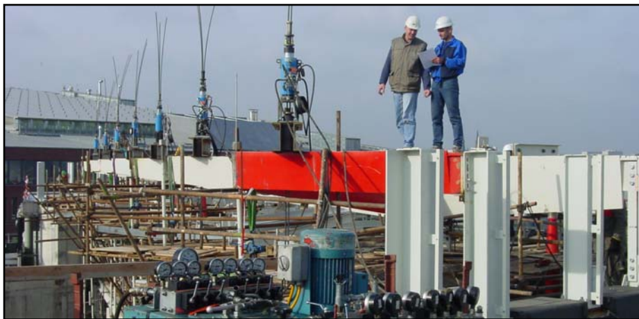
▲ Instalované zvedací jednotky SLU 30